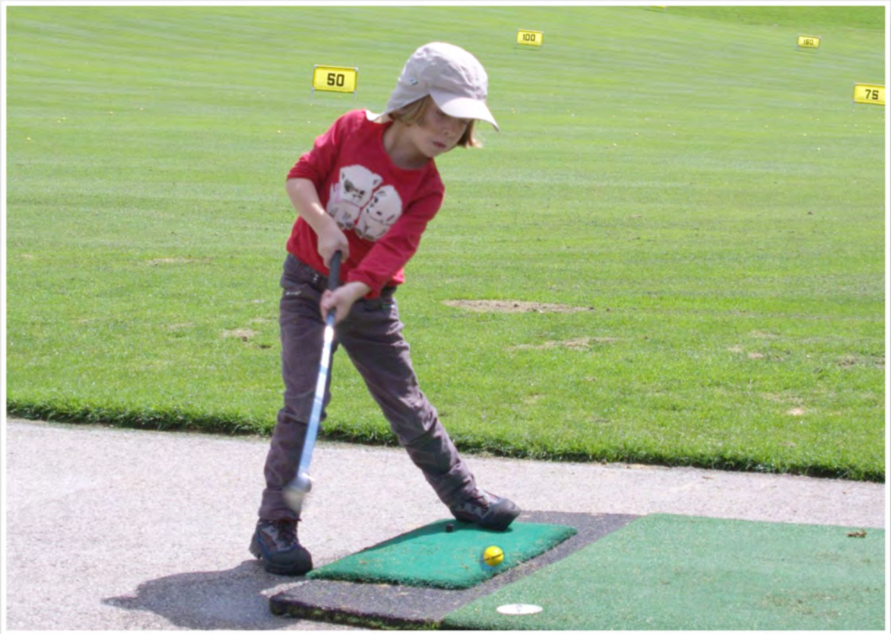
Golf ist ein Rentnersport