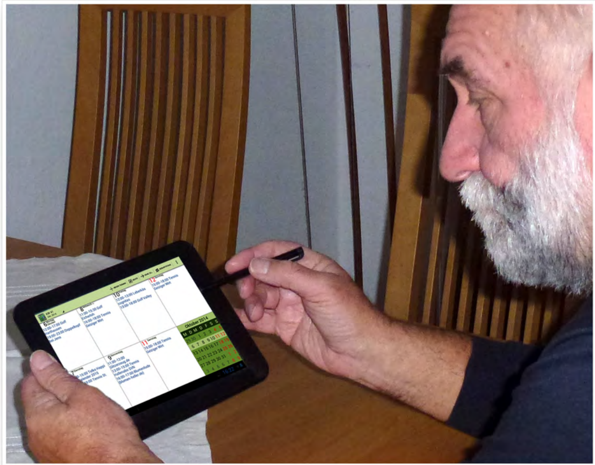
Rentner haben nie Zeit