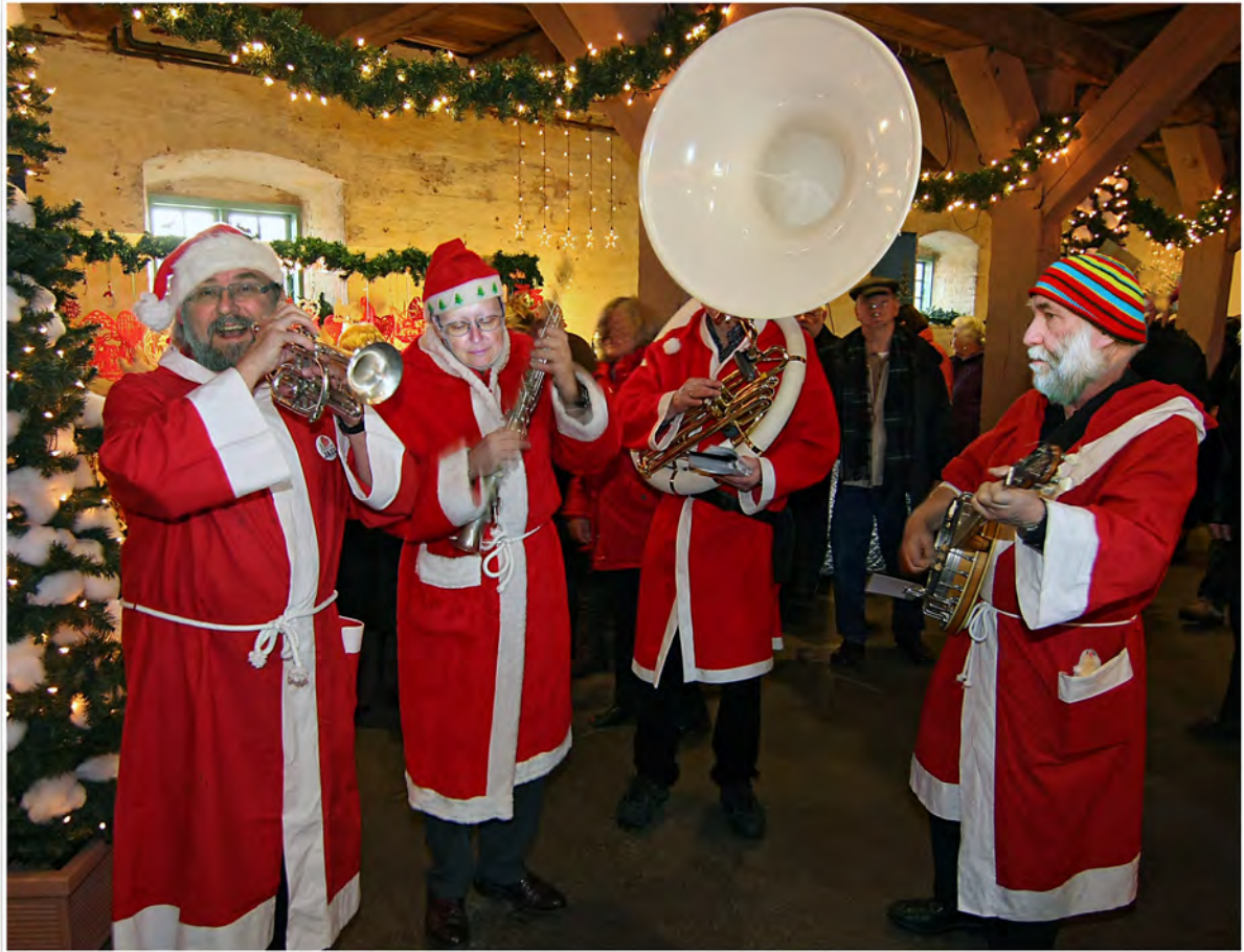
Den Weihnachtsmann gibt es nicht (der echte ist der 2. von rechts!)