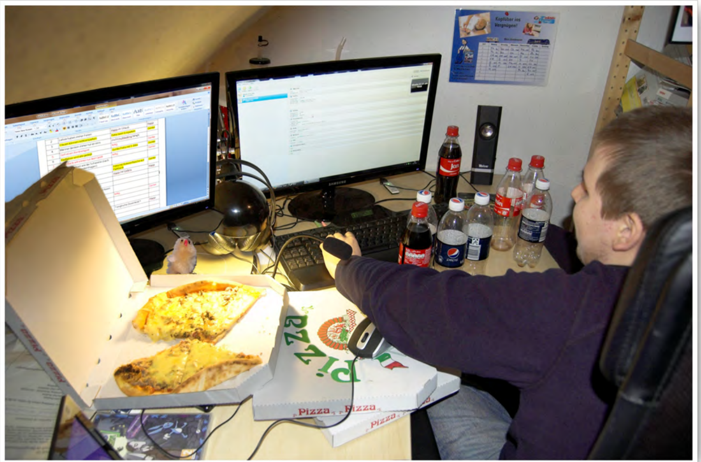
Nerds leben nur von Pizza & Cola