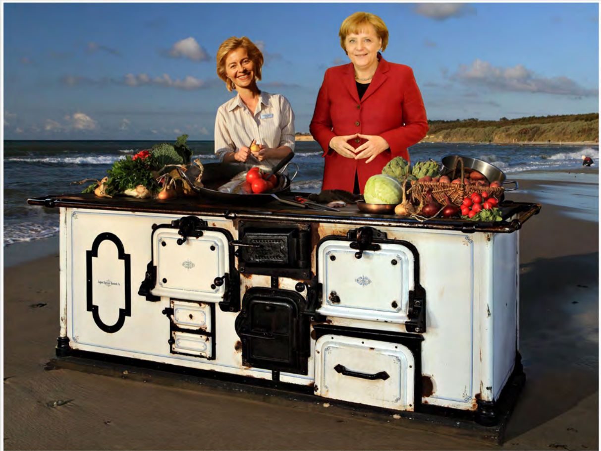
Frauen gehören hinter den Herd