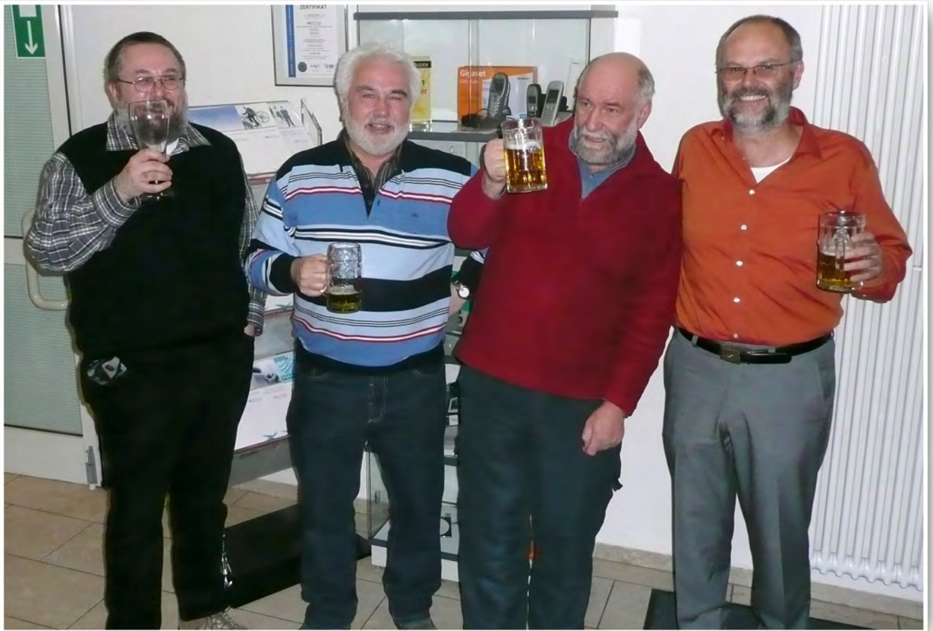
Bier macht dick