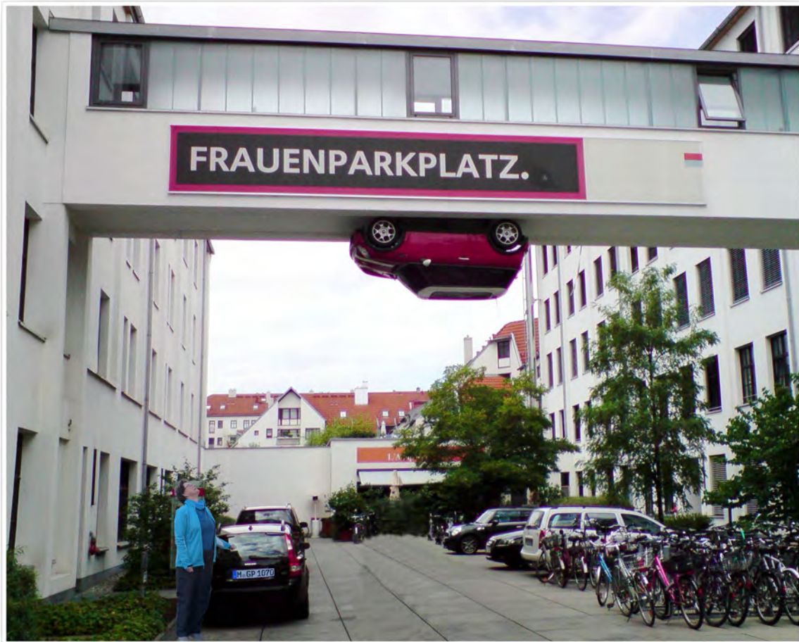
Frauen können nicht einparken