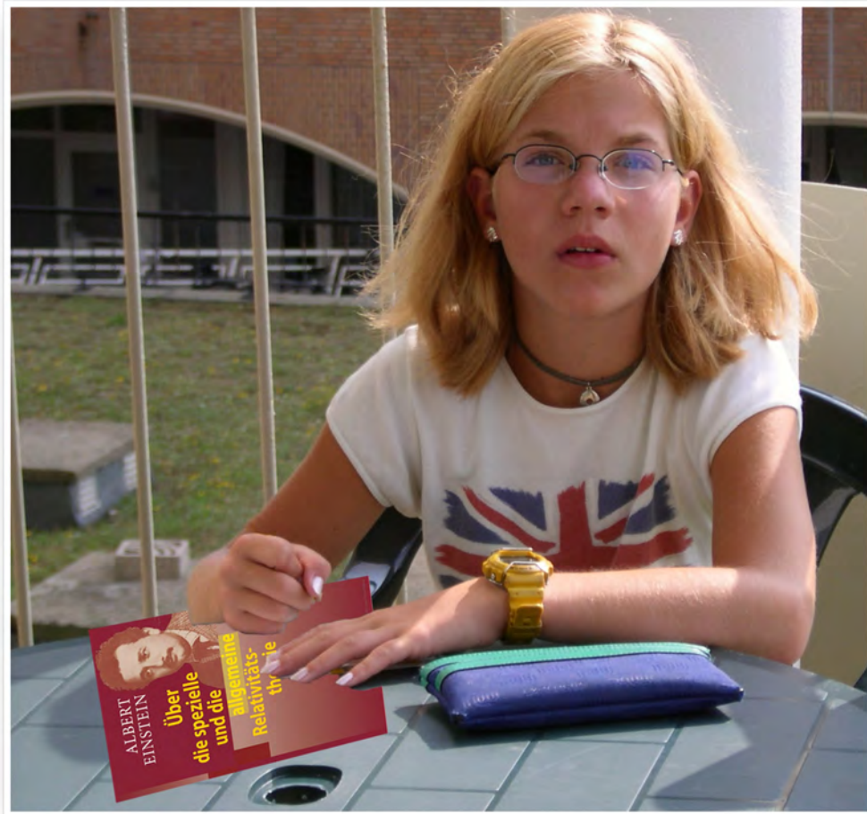
Blondinen sind dumm