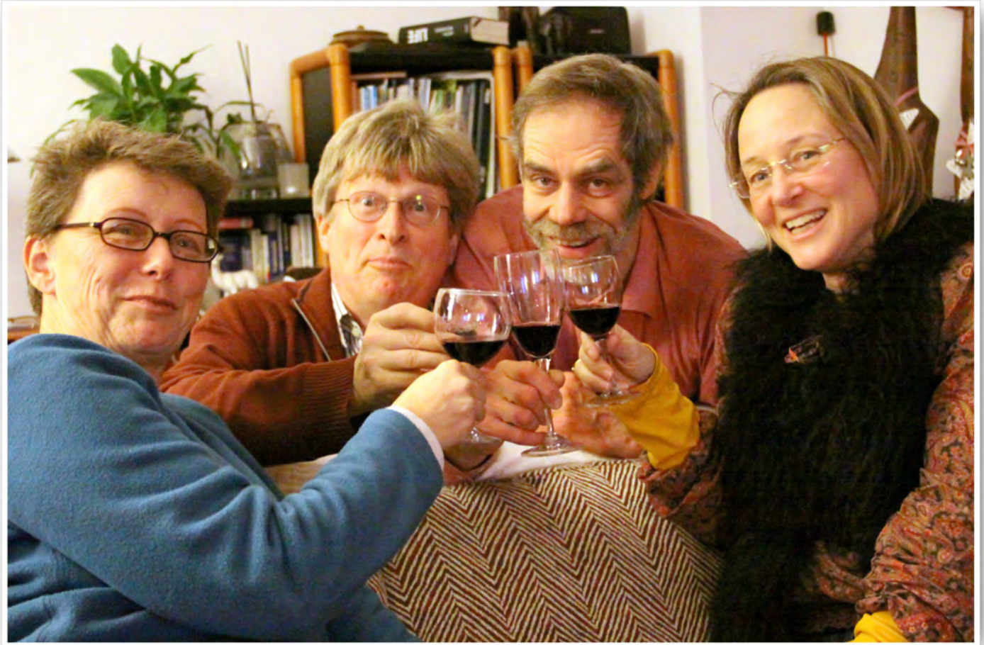
Rotwein ist gesund