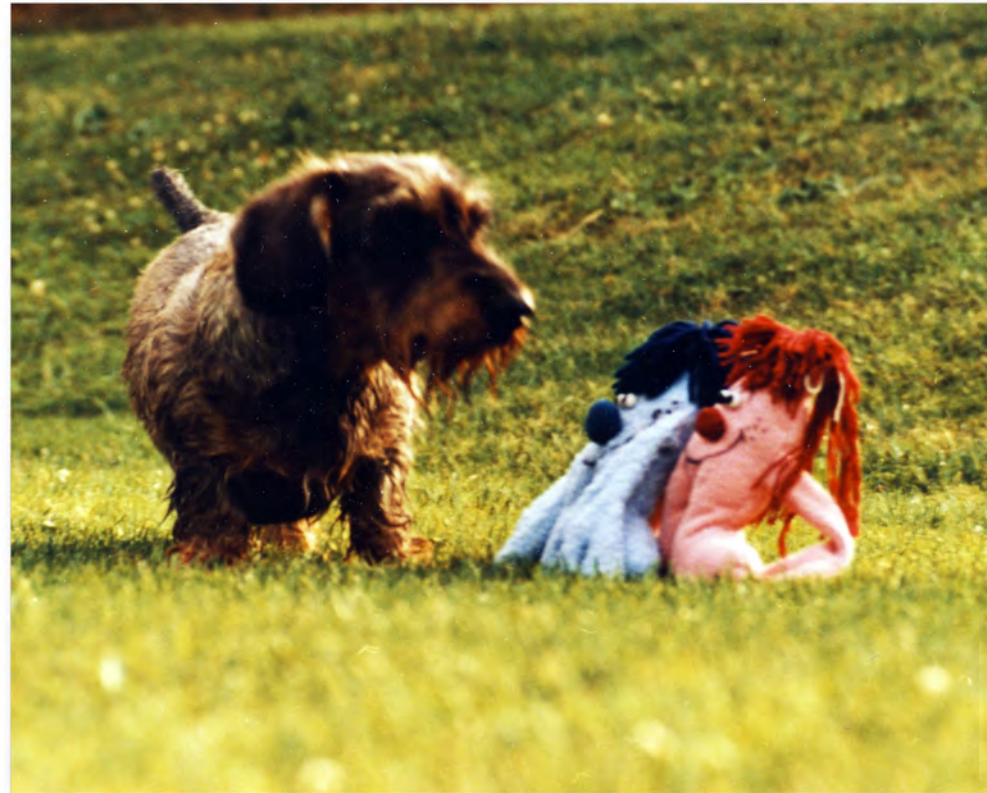
Lieblingshund der Bayern: A Zamperl, auch Wackerl oder Flaschnbutza genannt (hier mit zwei Schnuddeln, nichtbayrisch)