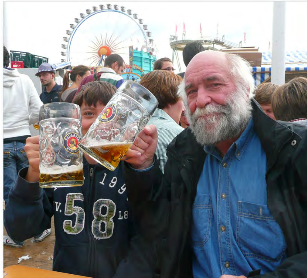
Nur noch ein Noagerl in der Wiesnmass