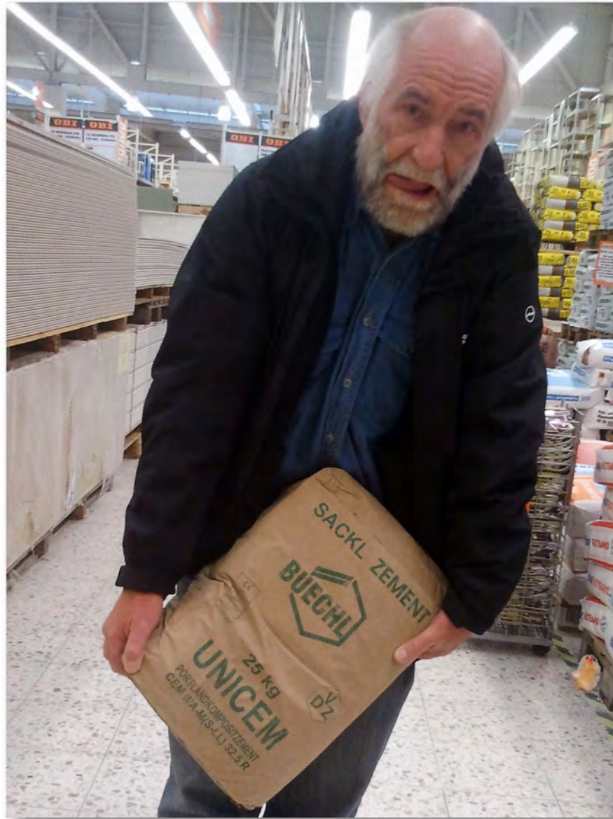
Sackzämendd, ist der schwer! (Dabei darf ich nichts tragen, was schwerer ist als ein Tragerl Bier)