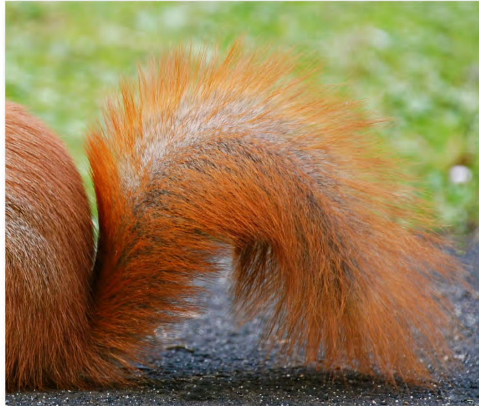
Oachkatzerlschwoaf (Das muss ein Preuße erstmal richtig aussprechen können!)

1 Mo 2 Di 3 Mi 4 Do 5 Fr 6 Sa 7 So 8 Mo 9 Di 10 Mi 11 Do 12 Fr 13 Sa 14 So 15 Mo