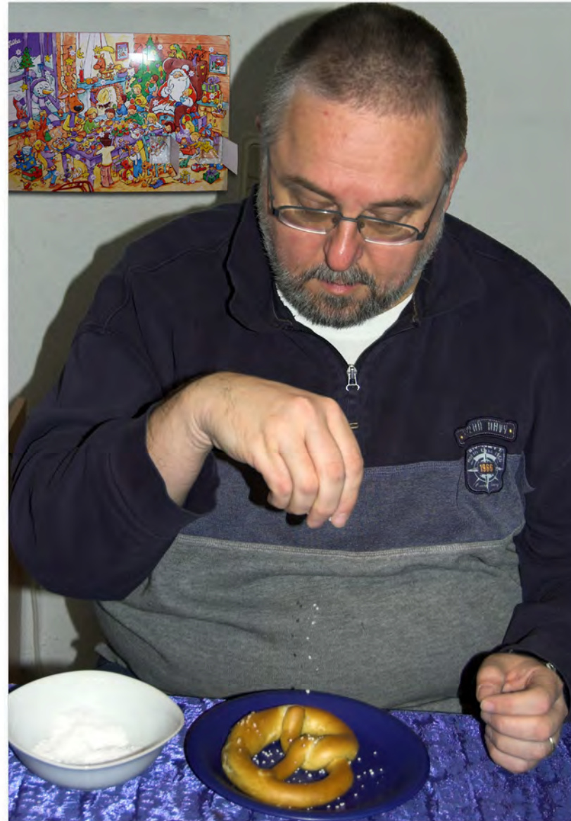
Happi, der oide Breznsoiza!