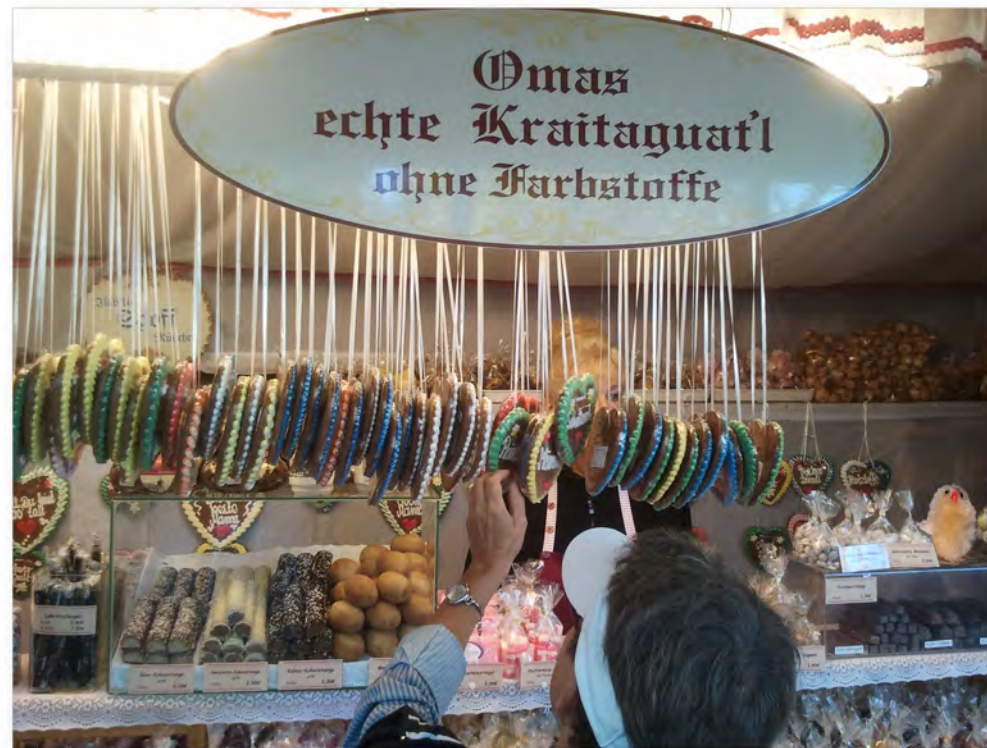
Auf der Auer Dult gib'ts echte Kraitaguatl