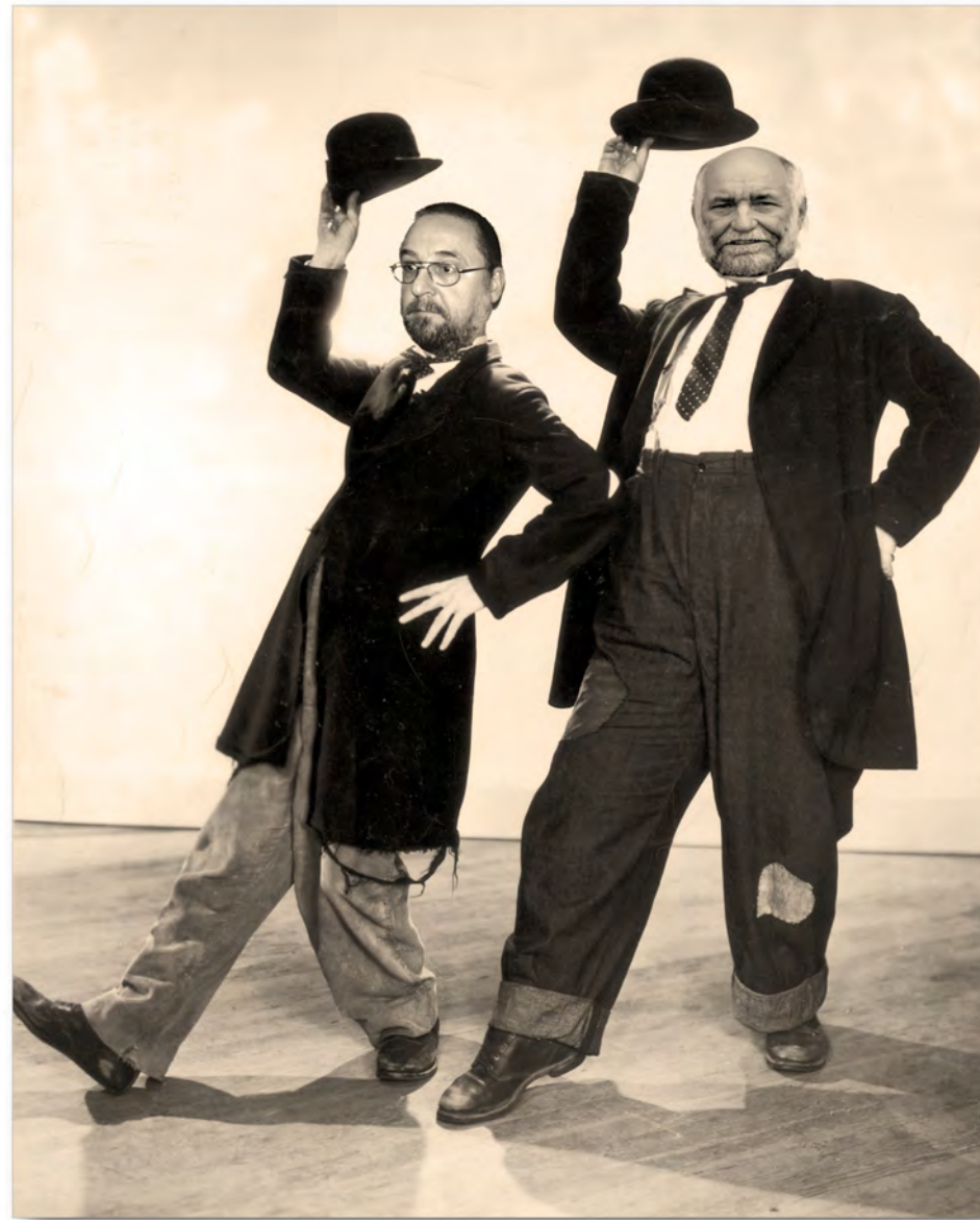
A Krischerl und a Wamperta