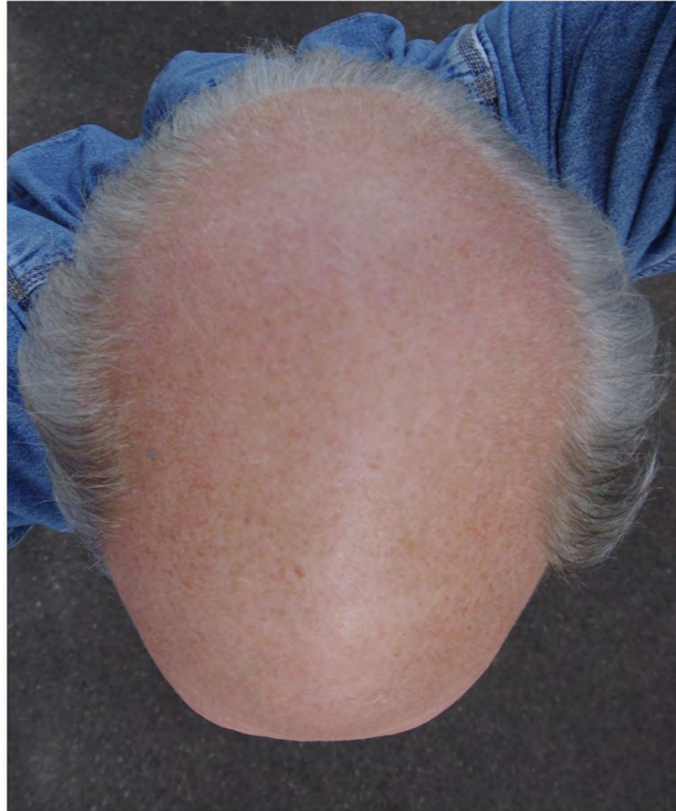
A Platterta (klingt besser als Glatzkopf!)