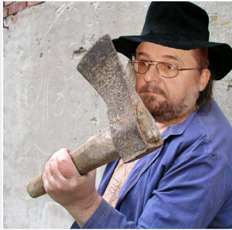
Happi bei einem Hacker-Angriff