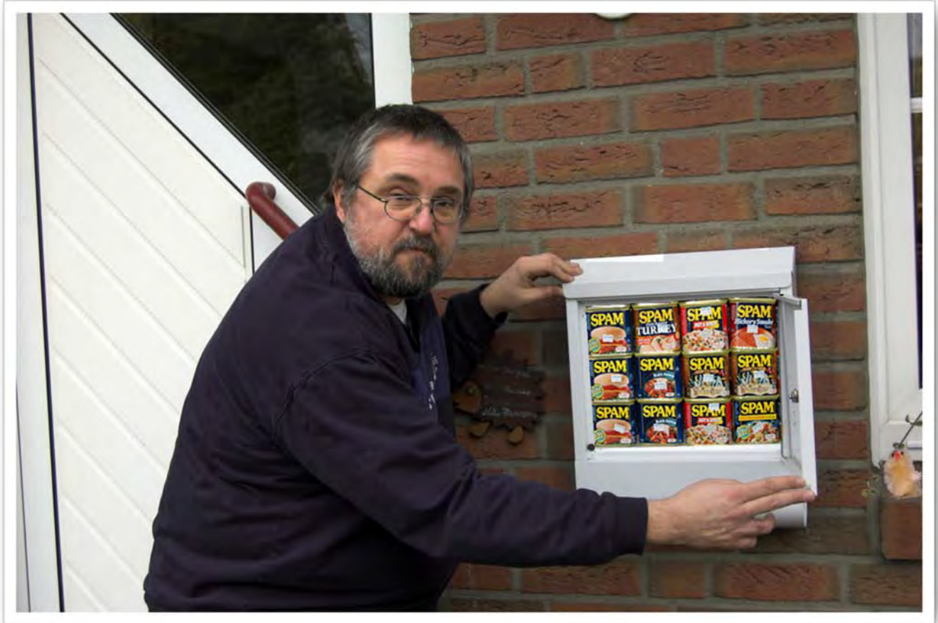
Immer dasselbe: Im Posteingang nur Spam!