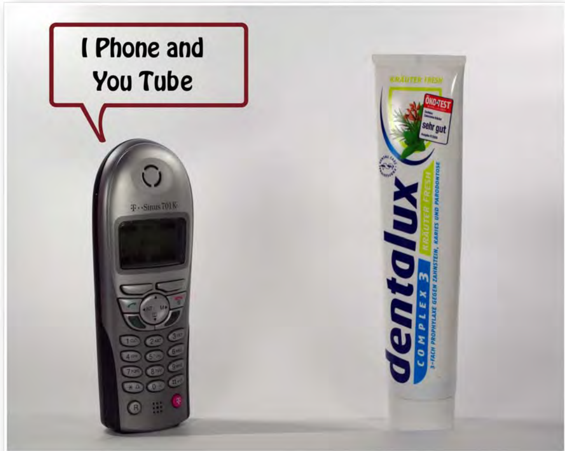
iPhone und YouTube: "Ich Telefon und du Tube"