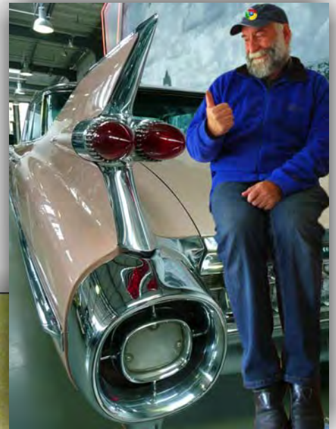
Und Günter steht auf Chrome!

Ins Internet kommt man mit einem Brauser. Hier die Lieblingsbrauser des Kalender-Teams: