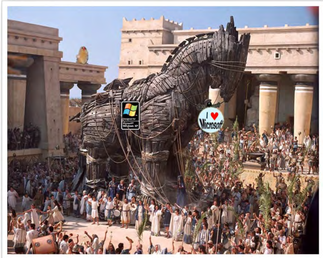
Im Internet lauern auch Trojaner