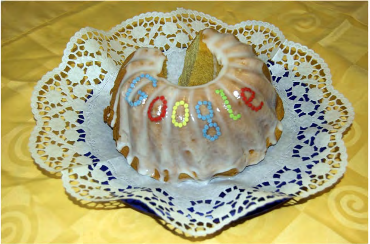
Original Googlehupf von Heike!