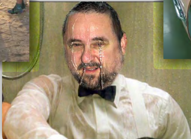
Happi mag am liebsten Opera!

Aber eigentlich kann es nur einen geben: den Ahoi-Brauser!!!