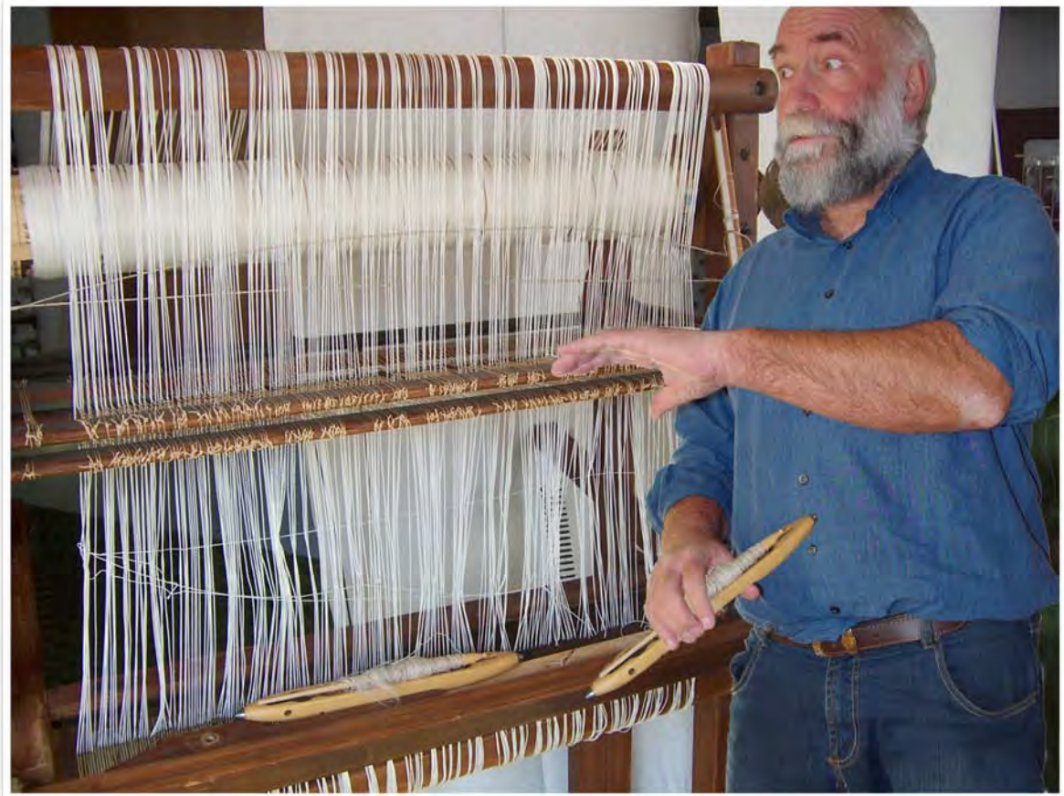
Der Webmaster inspiziert an seinem Arbeitsplatz eine Webseite