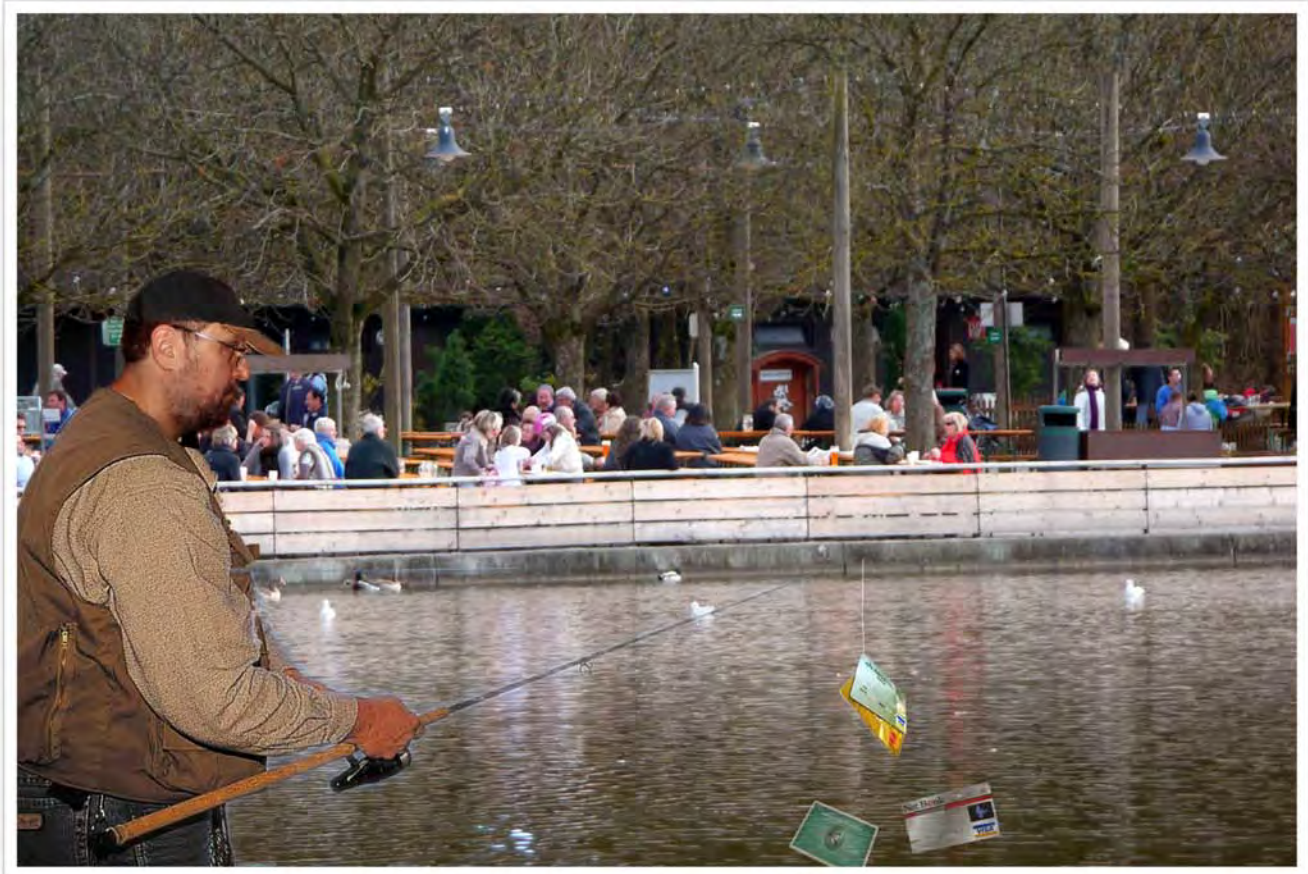
Happi beim Phishing am Ostparksee