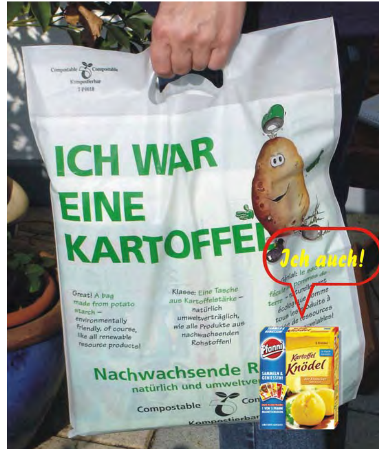
Kartoffel-Recycling á la Pfanni!