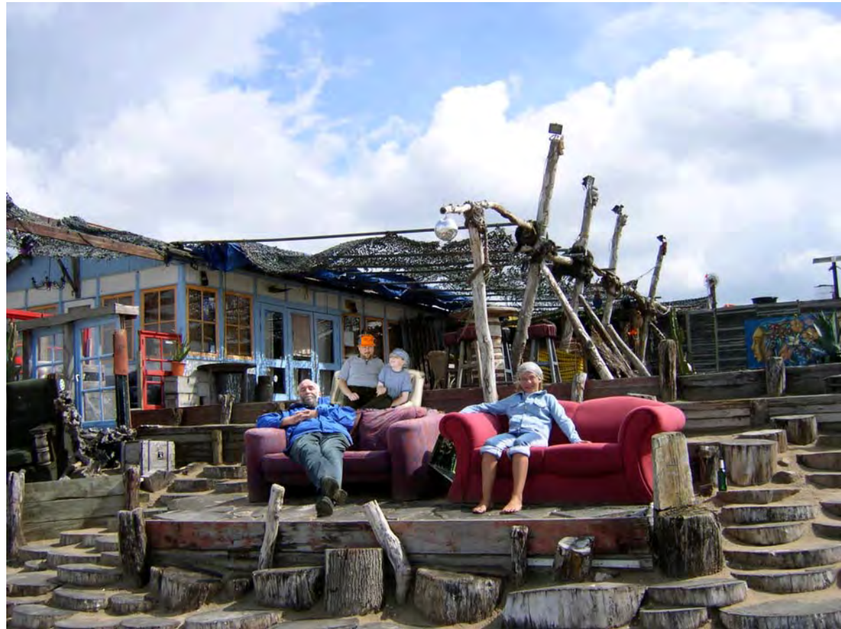
Alte Postermöbel erfüllen immer noch im Strandcafe ihren Zweck