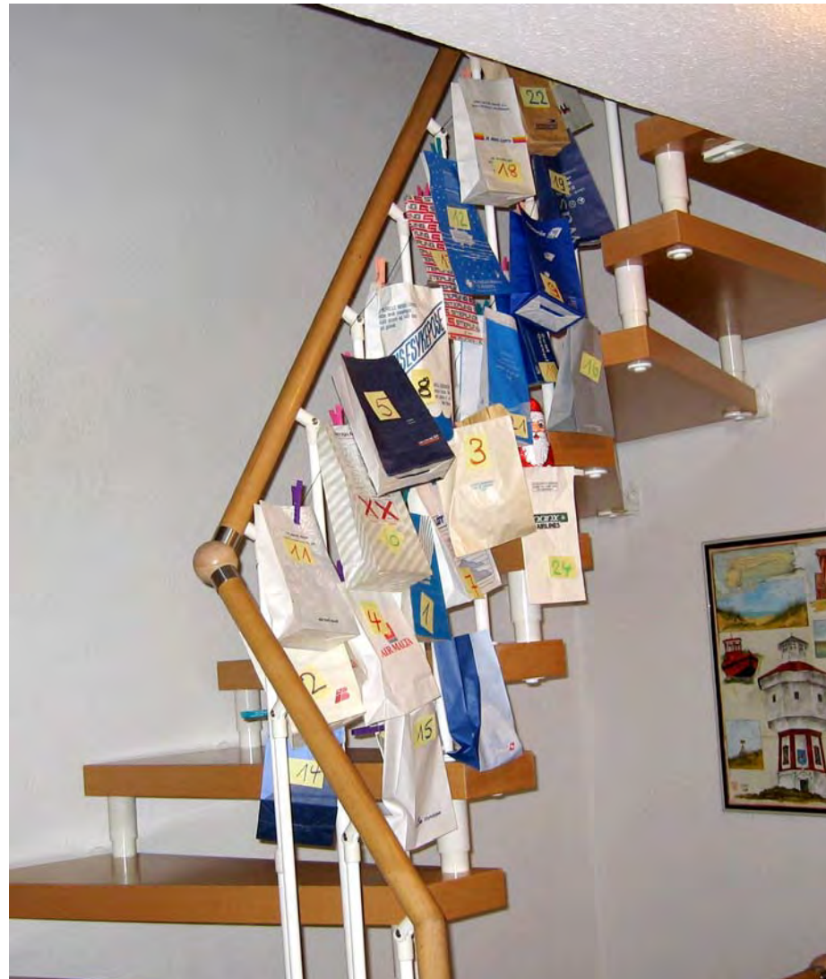
Ein Adventskalender aus (unbenutzten!) Kotztüten bringt festliche Stimmung in jede Wohnung