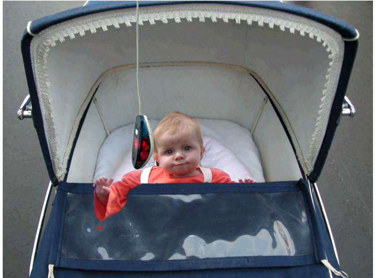
Ausgediente Mäuse eignen sich gut als pädagogisches (?) Spielzeug