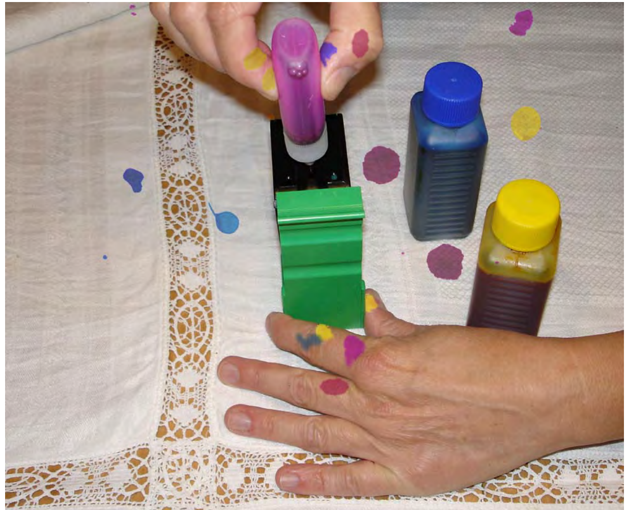
Sehr beliebt und umweltfreundlich: Das Recyclen von Tintenpatronen!