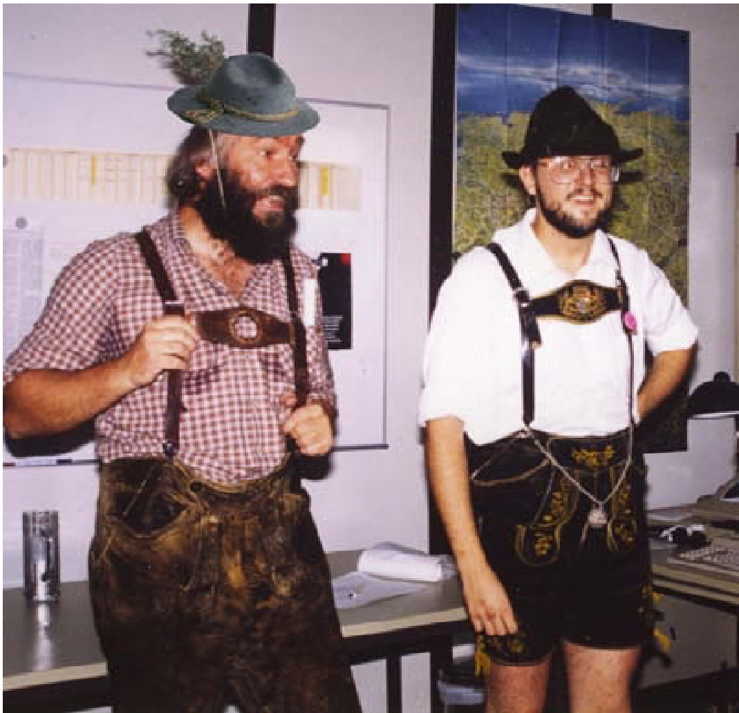
Lebenslüge des Monats: Naja, wer`s tragen kann!